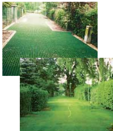
Aplikace po montáži a finální podoba